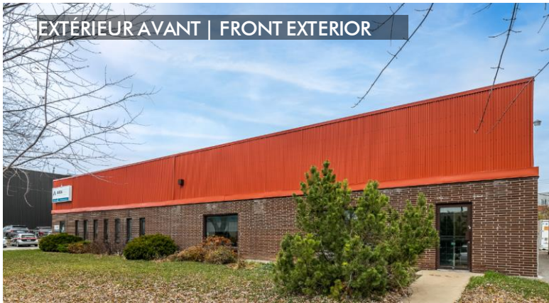
EXTÉRIEUR AVANT | FRONT EXTERIOR