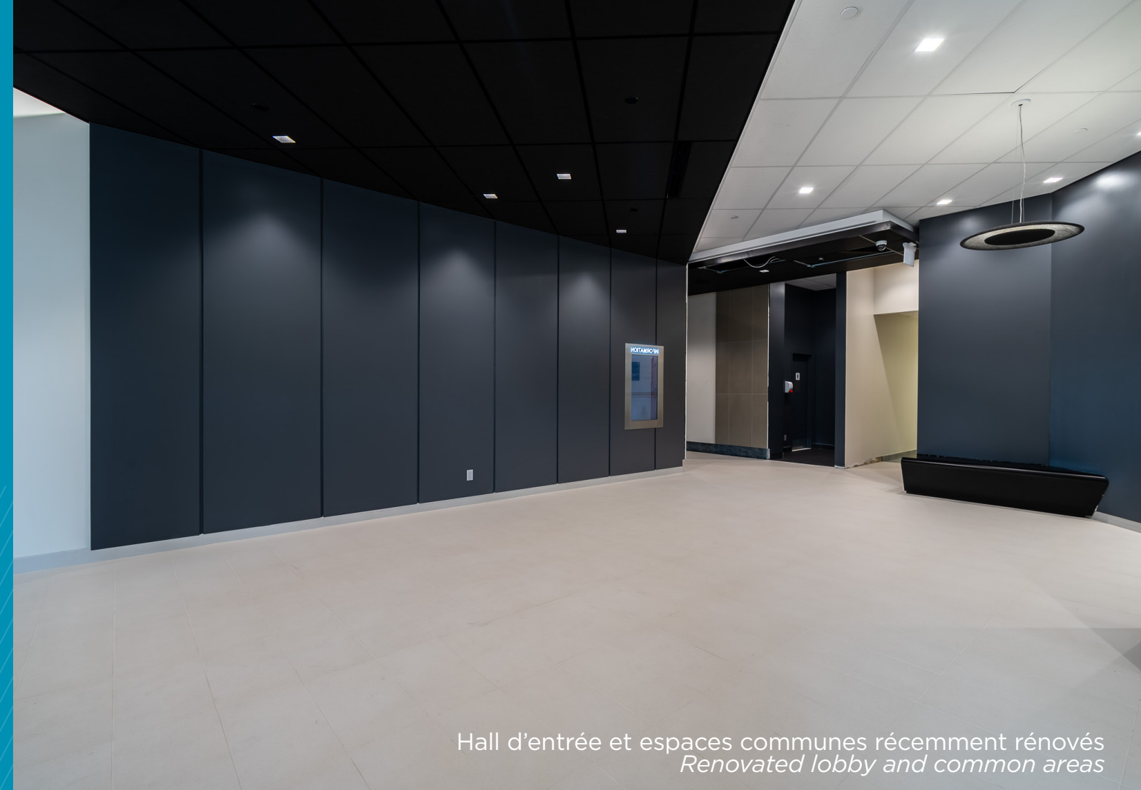
Hall d'entrée et espaces communes récemment rénovés Renovated lobby and common areas

PARFAITEMENT INTÉGRÉE AU MARCHÉ CENTRAL, LA TOUR DE BUREAUX OFFRE AUX LOCATAIRES UN ACCÈS INÉGALÉ À DE NOMBREUX SERVICES ET COMMODITÉS, TOUS ACCESSIBLE À PIED